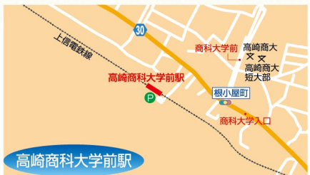
高崎商科大学前駅

各駅駐車場は、上信線利用者専用の駐車場です。通勤・通学といった定期利用のほか、1日だけのご利用もちろん可能です。