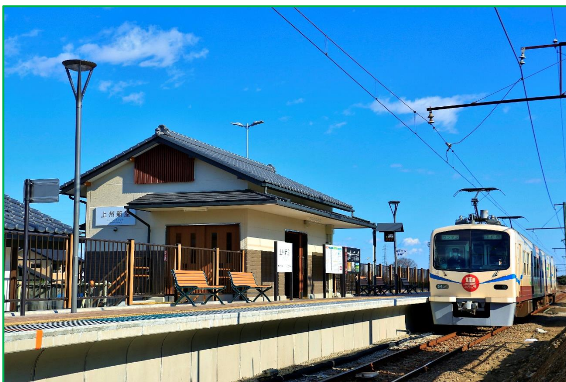
上州新屋駅（新駅舎）

この安全報告書は、当社における2022年度鉄道輸送の安全確保のための取り組みや安全・安心の実態をまとめたものです。