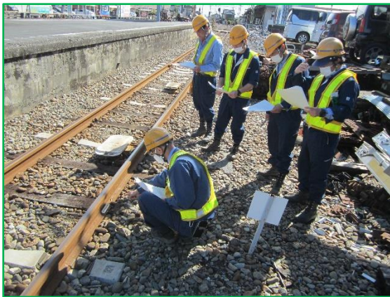
保線係 レール測定訓練

輸送の安全を確保するために年間教育訓練計画を立て、知識・技能の向上を目指し教育、研修を実施しております。また、様々な異常時に対応出来るよう実地訓練を随時実施しております。