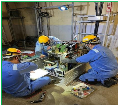
山名変電所遮断機オーバーホール