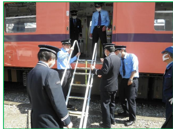
駅員 非常はしご設置訓練