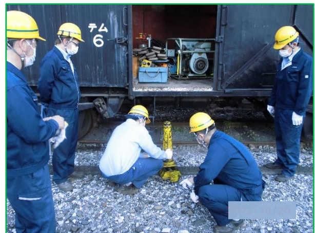
車両区 非常用器具取扱訓練