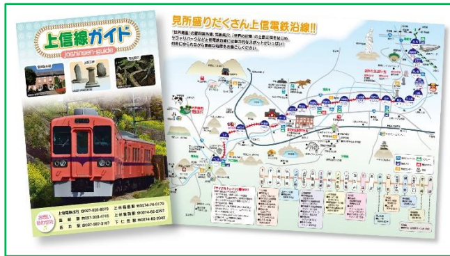
上信線観光マップ