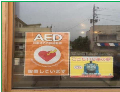
子供110番の駅・AED設置ポスター