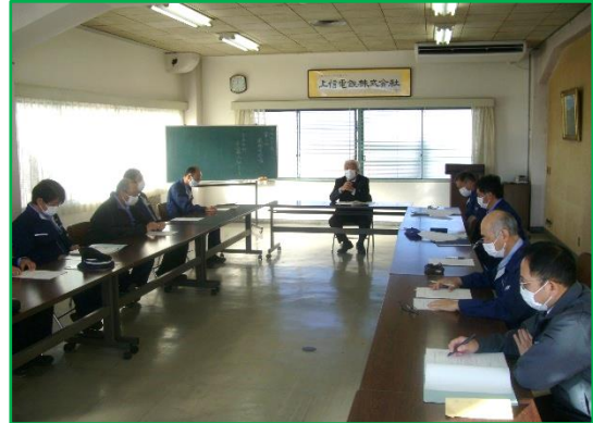
経営トップが出席する職場長会議

夏季(8月1日～8月10日)及び年末年始(12月10日～1月10日)の年2回、社員一人一人が安全性の向上を図るとともに、安全意識の高揚を目的とした「輸送の安全総点検」を実施いたしました。