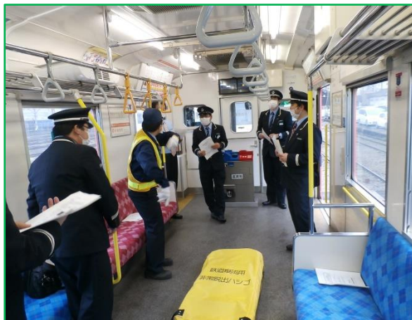
運転士 旅客誘導訓練