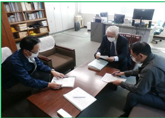
安全マネジメント内部監査

社長、安全統括管理者及び部長、担当課長が随時現業職場を巡回また、列車添乗等を行い現業社員と直接対話し、取組や実作業の確認を行いながら安全意識の高揚を図っております。