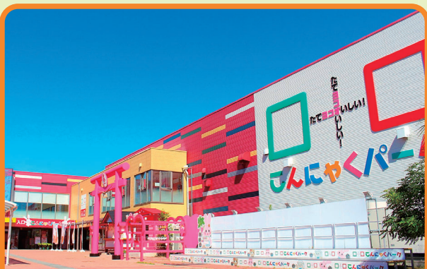
こんにゃくパーク