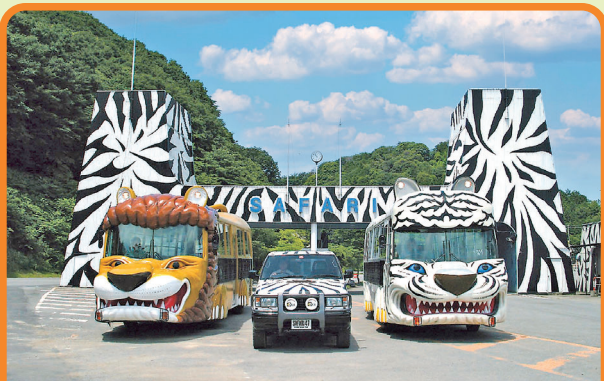
群馬サファリパーク