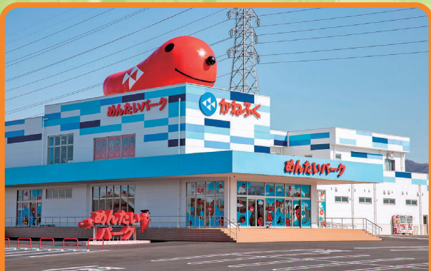
めんたいパーク群馬